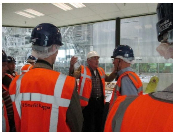
De deelnemers aan de themadag kregen een goed georganiseerde rondleiding door de Parenco papierfabriek