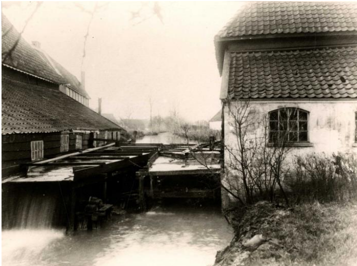
Een van de foto's van de Holthuizer Molen

Dankzij een recente schenking zijn zeven foto's van de Holthuizer Molen aan de collectie Papiergeschiedenis in CODA Archief toegevoegd. De foto's van deze papiermolen dateren uit 1911. De molen stond aan de Grift in Apeldoorn en was generatieslang in het bezit van de familie Dijkgraaf. Ook deel van de schenking was een stapeltje handgemaakt papier met als watermerk het portret van de Duitse Sturm und Drang-dichter Friedrich Schiller.