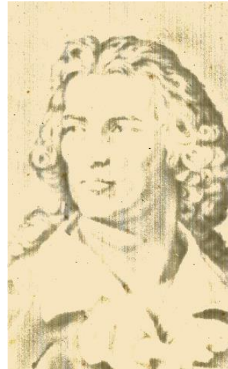
Watermerk met portret van Schiller

Vermoedelijk diende dit papier als proeve van de (grote) bekwaamheid van de paperscheppers van de Holthuizer Molen.